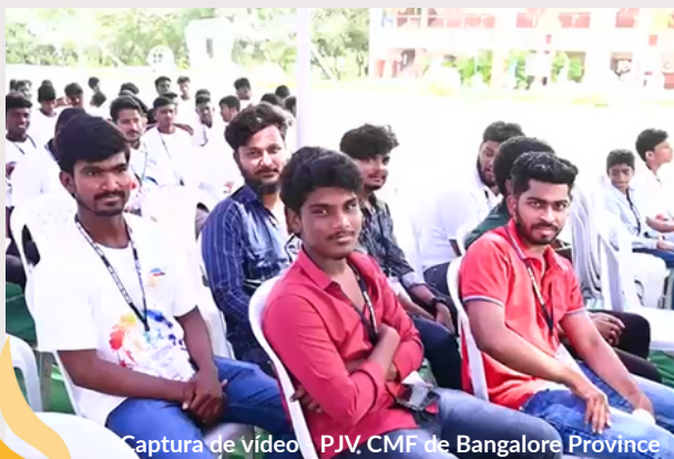
Captura de vídeo - PJV, CMF de Bangalore Province

Tras la mesa redonda, los participantes compartieron una comida de hermandad, en la que profundizaron en el sentimiento