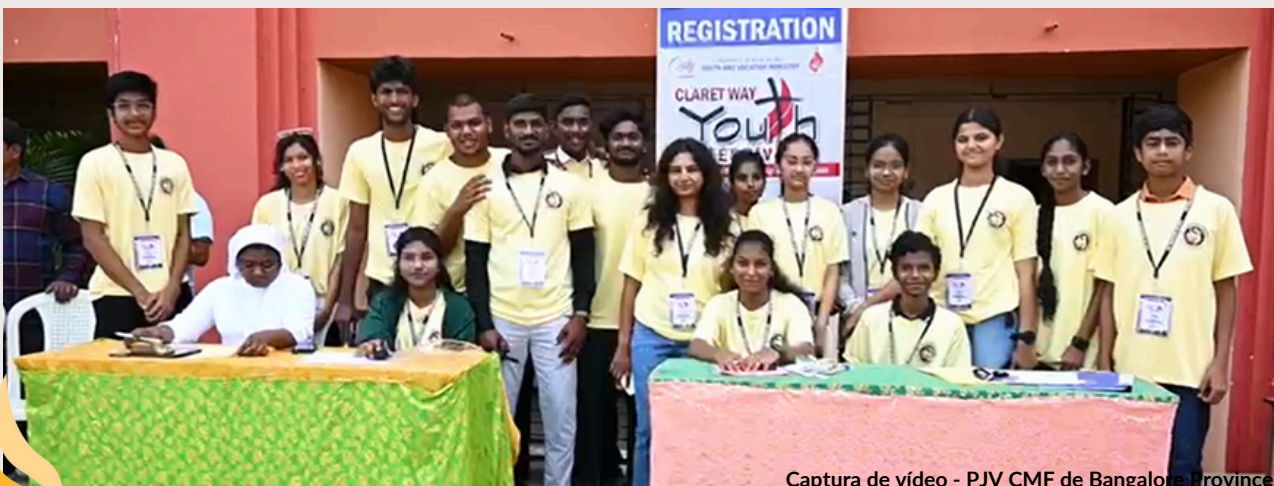
Captura de vídeo - PJV CMF de Bangalore Province