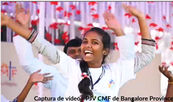
Captura de vídeo - PJV CMF de Bangalore Province

de comunidad y camaradería fomentado durante los días anteriores.