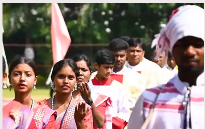
Captura de vídeo - PJV CMF de Bangalore Province