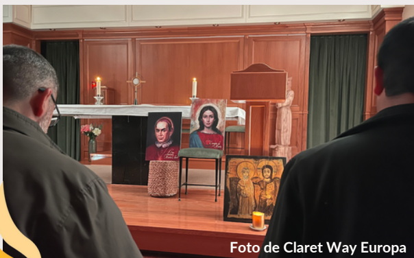
Foto de Claret Way Europa