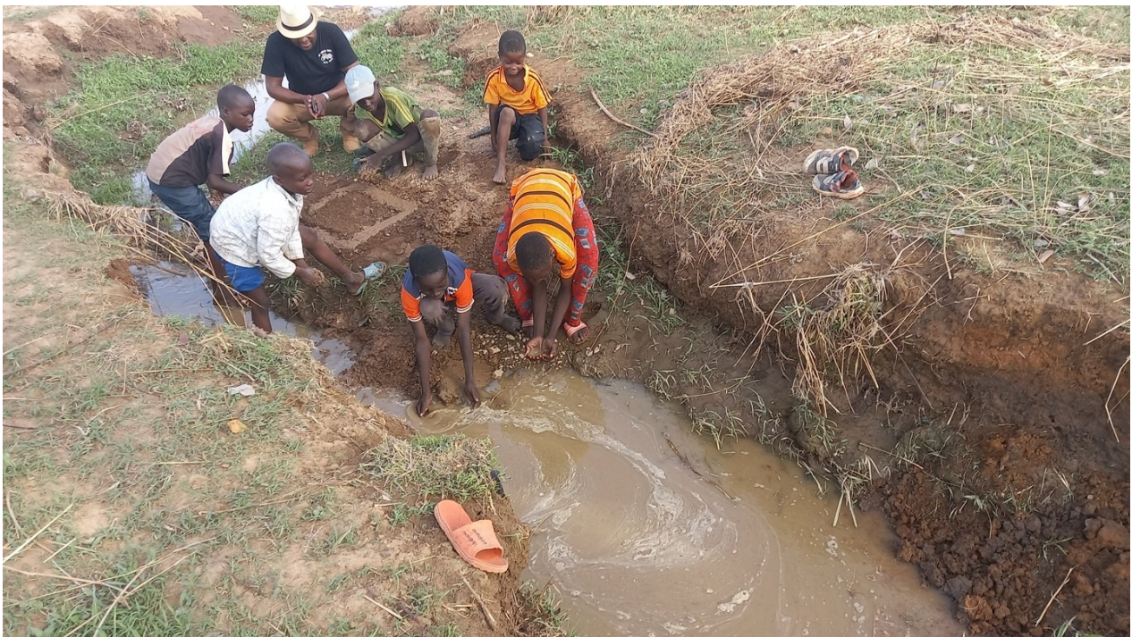
Claret Vida Imagen 3: La Fuente de la vida?

En las aldeas de nuestro territorio parroquial que llamaron nuestra curiosidad desde nuestra llegada a esta parte casi olvidada de Camerún, el agua es muy escasa. Durante la temporada de lluvias, que dura solo de 3 a 4 meses al año, la población puede recoger agua como puede, pero en la temporada seca se vuelve muy escasa e indrinkable. Se observan muchas enfermedades en esta área debido al consumo de agua de ríos y lagos. Esto explica nuestra motivación para dirigir nuestro primer proyecto hacia la realización de pozos y tanques elevados para contribuir así a aliviar el dolor social de la población.