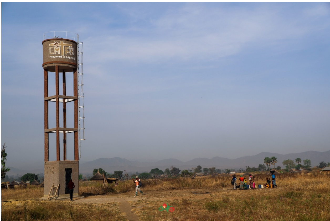
Claret Vida Imagen 4: Este es un ejemplo de pozos de agua construido en diferentes aldeas.