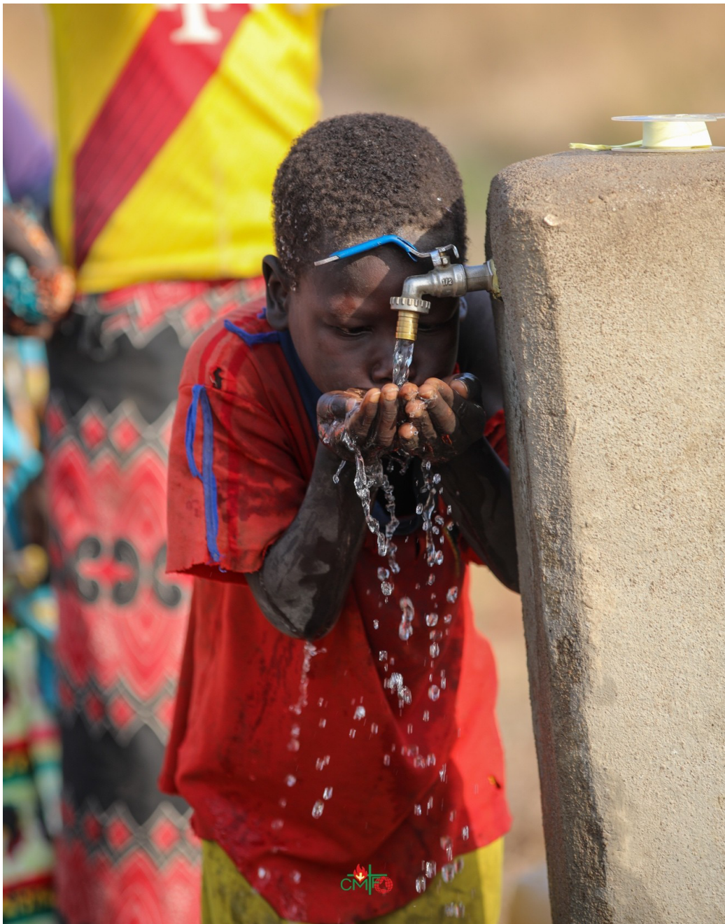
Claret Vida Imagen 1: Bebiendo del Manantial de la Vida

EL AGUA ES VIDA, EL AGUA ES TODO, EL AGUA NOS LIBERA