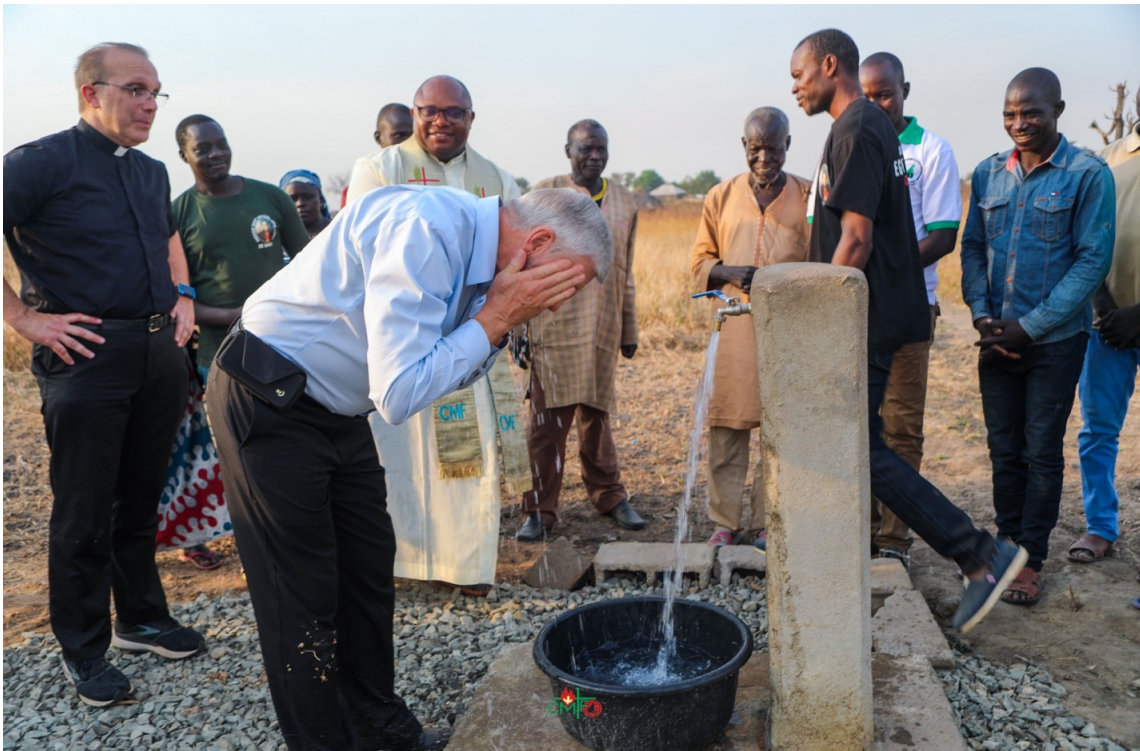
Claret Vida Imagen 8: El agua es emancipación