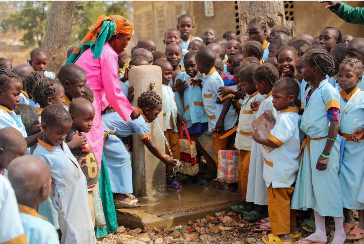
Claret Vida Imagen 7: El agua es educación