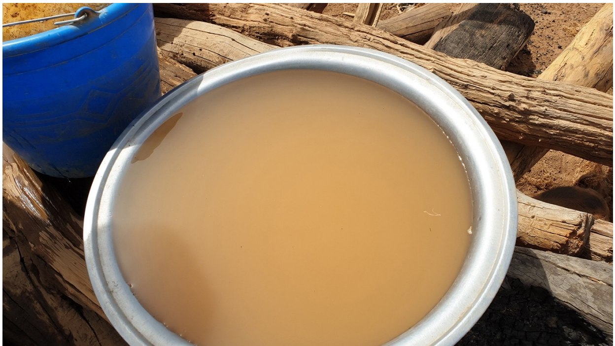
Claret Vida Imagen 2: Esto no es TÉ, esto es agua.