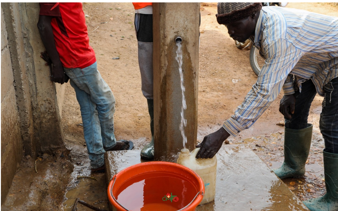
Claret Vida Imagen 6: Esto es agua limpia