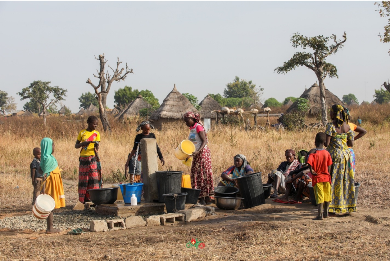
Claret Vida Imagen 5: El agua es fraternidad